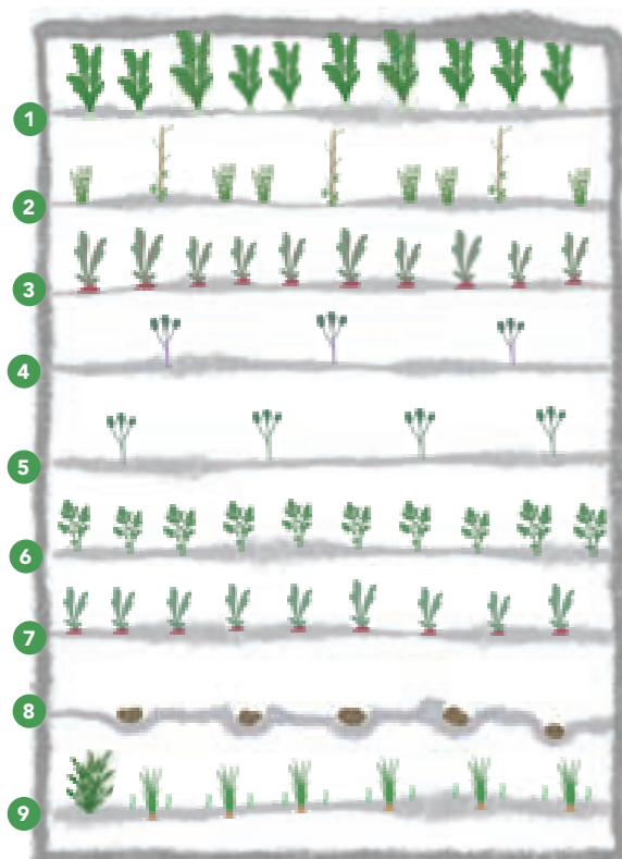
Deine neun Beetreihen warten auf die ersten Einsaaten. Mais und Bohnen können im Haus vorgezogen werden.

Mit diesem Beet schaffst du dir ohne viel Klimbim eine solide und vielfältige Grundlage für eine volle Speisekammer. Die Kulturen sind so gewählt, dass Groß und Klein das ganze Jahr über ernten und füttern können.